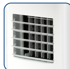
Alette frontali motorizzate, con posizione fissa o oscillazione automatica Front motorized flaps, with fixed position or automatic vertical swinging