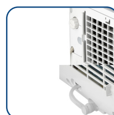
Doppio drenaggio condensa Double condensate draining