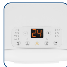
Pannello comandi digitale con display a LED Digital control panel with LED display